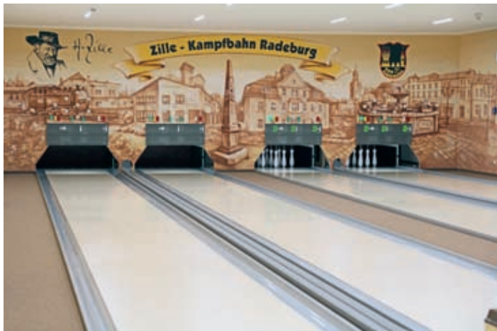
Zillekampfbahn im Sportzentrum Radeburg