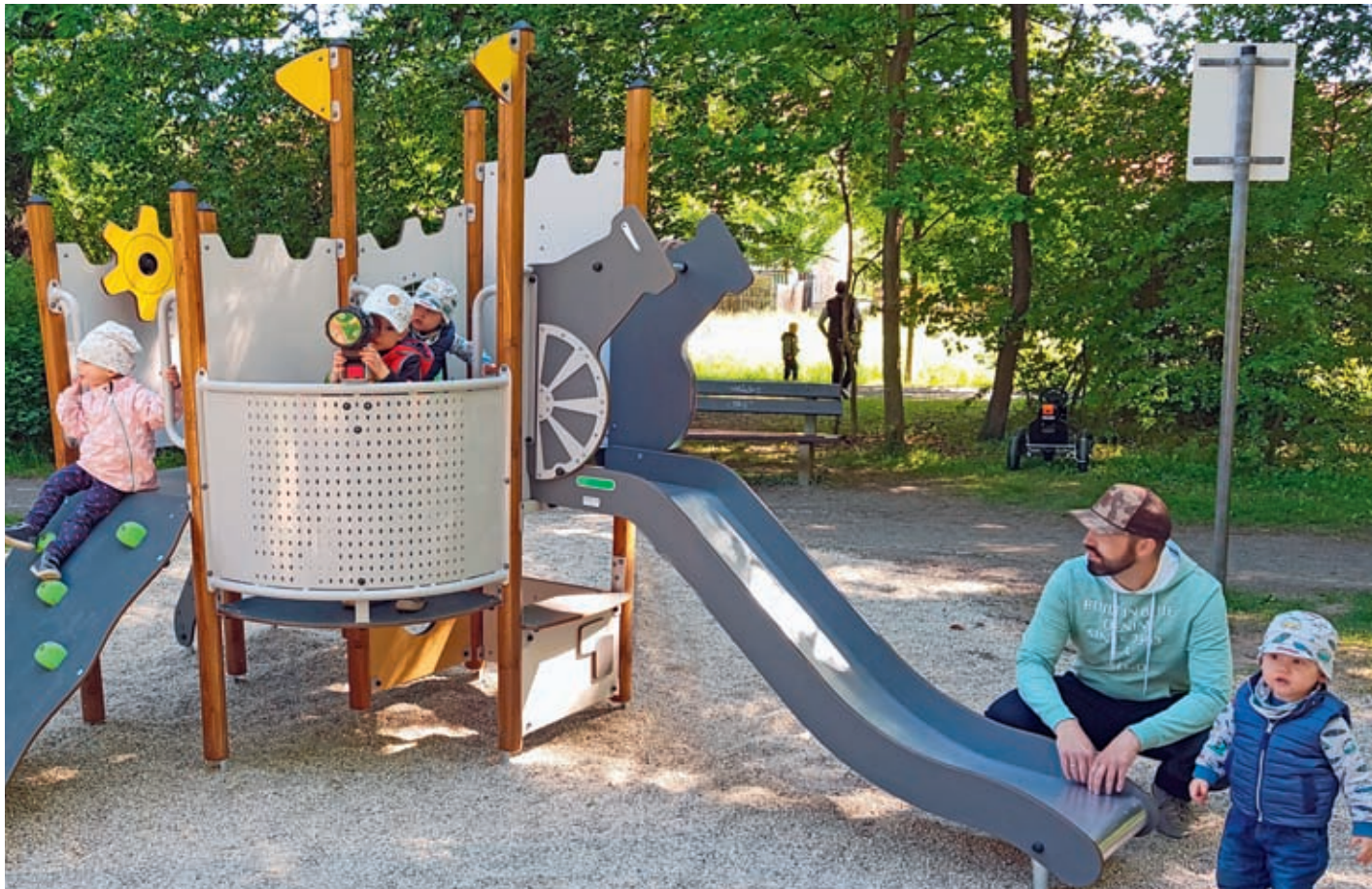
Der Heinrich-Zille-Hain, Radeburgs Stadtpark wurde am Pfingstmontag genau vor 10 Jahren von einem Tornado heimgesucht, Vandalismus sorgt für weitere Schäden. Der Downburst vom 12. Juli letzten Jahres gab ihm gewissermaßen „den Rest“. Etliche Wege waren ausgespült und ähnelten eher Gebirgspfaden. Doch nun tut sich etwas. Teil der Parksanierung ist die Erneuerung des Spielplatzes, der in den letzten Tagen von Kindern mit großer Freude in Nutzung genommen wurde.

Unabhängige Zeitung mit den Amtsblättern der Stadt Radeburg und der Gemeinde Ebersbach