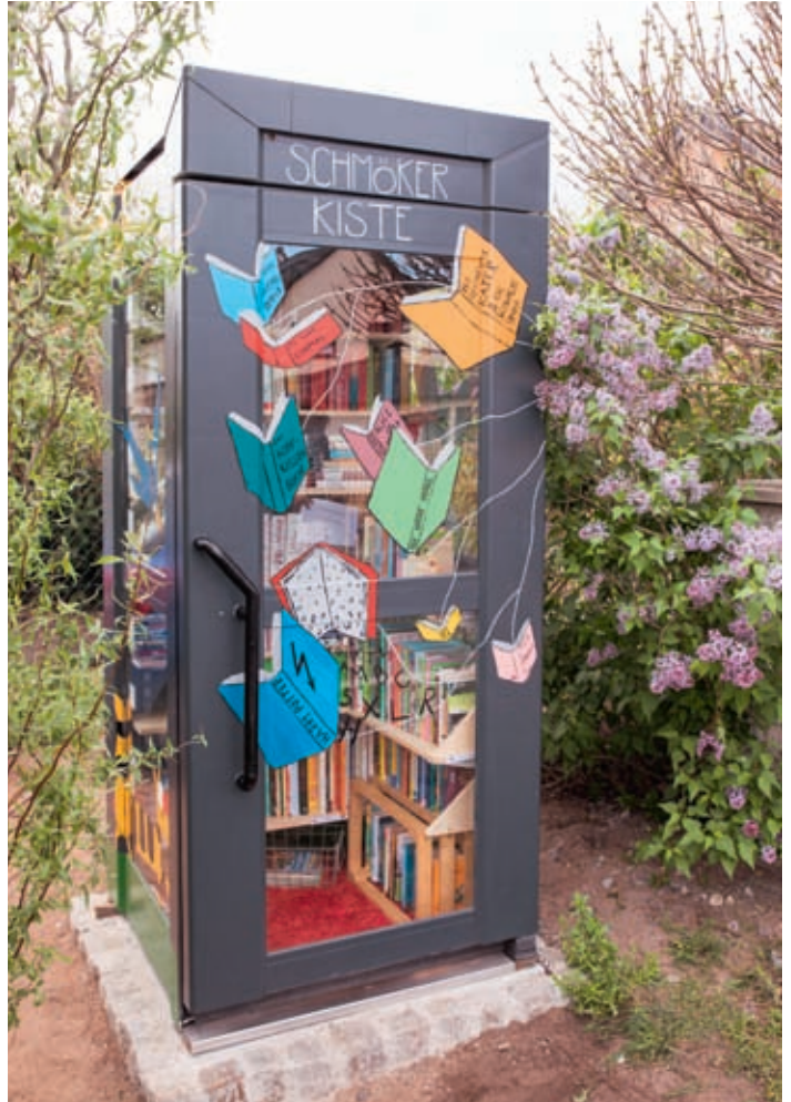
Schmökertüte, ein wenig versteckt, an der Bärnsdorfer Hauptstraße

Über Corona lässt sich nicht viel Gutes sagen, außer vielleicht, dass die Krise manchen Impuls gegeben hat, Ideen umzusetzen, die es sonst gar nicht gegeben hätte oder die man vielleicht hatte, nur fehlte die Zeit. So ungefähr verhält es sich mit der Telefonzelle, die ungefähr 200 Meter hinter den Bahnschienen am Ortseingang von Bärnsdorf auf der rechten Seite steht.