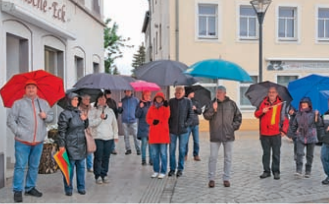
Montagsspaziergänger auf dem Radeburger Marktplatz beim ersten Spaziergang am 11. Mai

Der Landkreis Meißen ist einer der ersten im Freistaat, der keine Neuinfektionen meldet. Der Protest gegen die Corona-Schutzverordnung, der sich vor allem um die Frage der Verhältnismäßigkeit dreht, nimmt zu. Auch Radeburg gehört jetzt zu den Orten mit Protestlern. Die Proteste im Landkreis verlaufen bisher friedlich.