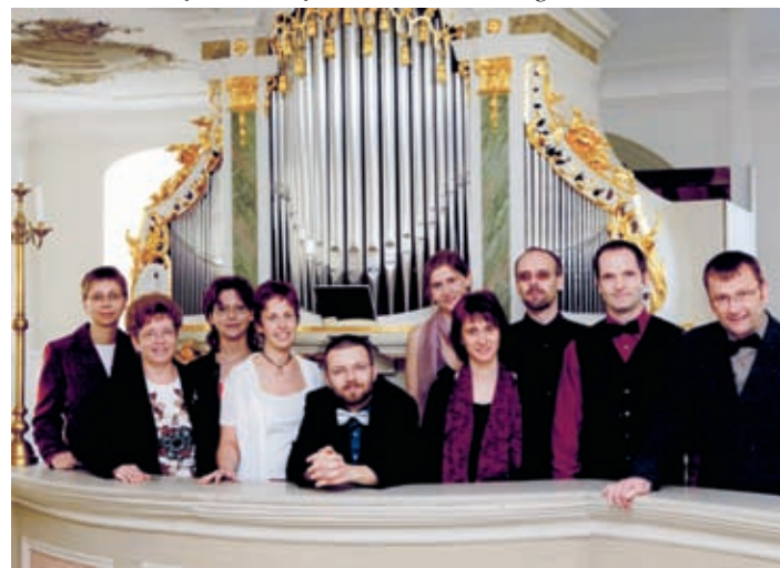
Der Comedian Harmonists Revival Chor