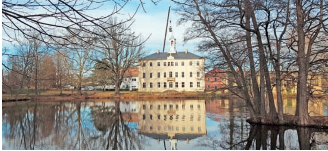
Der krönende Abschluss mit dem Kran: die goldene Kugel mit den Namen der Turmherren und die Wetterfahne werden aufgesetzt.

Hopfenbachflöhe der Kindertagesstätte Lauterbach waren gekommen, um den Turm auf's Dach schweben zu sehen und einen Teil lebendig gewordener Schlossgeschichte miterleben.