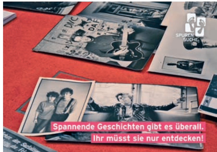
Spannende Geschichten gibt es überall. Ihr müsst sie nur entdecken!

Welche Spuren der letzten Jahrhunderte gibt es in meiner Region zu entdecken? Wie haben meine Eltern ihre Jugend in unserem Ort erlebt? Wie haben sich Menschen für meine Heimat engagiert? Wo kommen die Namen von Häusern, Straßen und Gassen her? Was hat sich in meinem Ort über die Jahrzehnte geändert? Welchen Einfluss hatte der Nationalsozialismus? Wie erlebten meine Großeltern und Nachbarn das System DDR, den Fall der Mauer, die Wiedervereinigung und das Leben im Umbruch?