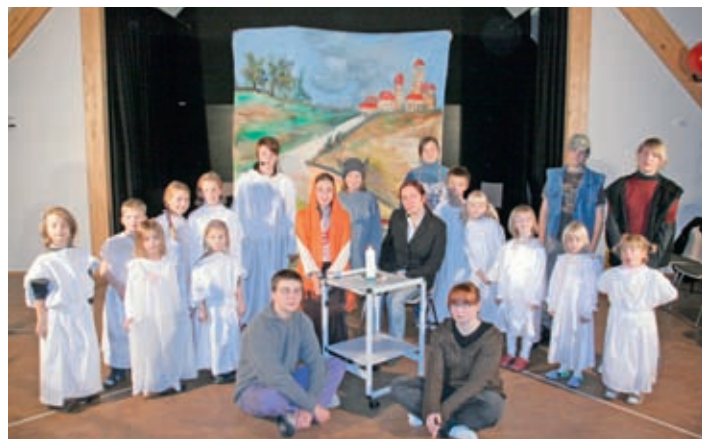
Die Mitwirkenden des Musicals „Du Kind in der Krippe“ von Stefan Jänke vor 10 Jahren. Bei den Aufführungen in dieser Weihnachtszeit singen und spielen die kleinen Engel von damals nun die Hauptrollen.

Aufführungen am 22., 24. und 29. Dezember in Großenhain und Reinersdorf