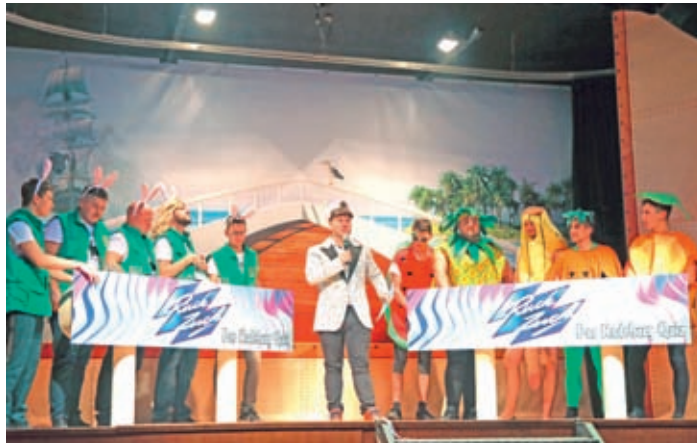
Ruck-Zuck: Rasse-Kaninchen (li.) unterliegen der veganen Konkurrenz.

Bekanntlich hat sich der Radeburger Carnevalseclub unter dem Motto „Kreuzfahrt RABU - wir schiffen ein!“ aus dem sprichwörtlichen Baustellenstaub gemacht. Wir berichteten in unserer letzten Ausgabe. Nun schulden wir dem geneigten Leser noch den „Rest“ des Saisonauftaktes. Nachdem das Prinzenpaar im Bordrestaurant Platz genommen hatte, wurden die Reisetilnehmer zum „zweiten Gang“ begrüßt. Kapitän Ole und Schiffskoch Mirco präsentierten, was sie so angerührt hatten. Zuerst hatten sie aber mit Motten zu kämpfen, die sich schließlich als Nachtfalter entfalteten und als Schmetterlinge über das Parkett flogen. Eine dynamische, farbenfrohe und effektreiche Show der Großen Schülergarde, mit der sie auch auf der großen Marktbühne beeindrucken wird.