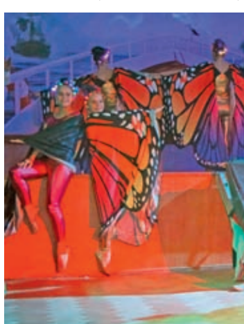
Kleine Schülergarde: Nachtfalter und Schmetterlinge.