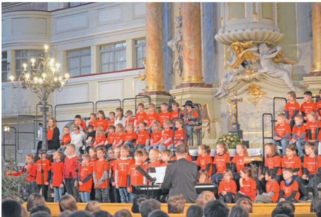
Adventsatmosphäre kann man beim Weihnachtssingen der 1. Grundschule schnuppern.

Chorklassen laden am Do, 19.12. 9.45h in die Marienkirche Großenhain