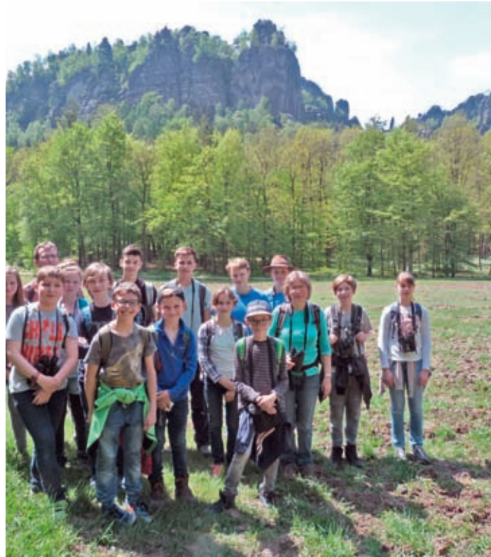
Die Kinder und Jugendlichen auf Exkursion im Elbsandsteingebirge.

Das gemeinsame Entdecken und Beobachten der heimatischen Tier- und Pflanzenwelt, Aktionen zu deren Erhalt und Schutz und damit die Sensibilisierung für die Schönheit unserer Natur im Wandel der Jahreszeiten sowie Aneignung von umfangreichem naturkundlichem Wissen sind seit über 30 Jahren Inhalt der Kinder und Jugend Natur AG Großdittmannsdorf. Auch in diesem Jahr waren wir wieder regelmäßig in der Wald-, Feld- und Teichlandschaft in und um Großdittmannsdorf unterwegs, haben gemeinsam Ausflüge unternommen oder Arbeitseinsätze durchgeführt. Traditionell begann unser „Naturjahr“ mit der „Stunde der Wintervögel“ am 5.1.19. Wie jedes Jahr beobachteten wir in mehreren kleinen Gruppen an unserem Futterhaus die heimischen Vogelarten. Ein Ausflug ins Museum der Westlausitz nach Kamenz stand im Februar auf dem Programm. Wir schauten uns Gewölle näher an und bestimmten anhand der kleinen Speisereste, welche Mäusearten oder Käfer auf dem Speiseplan von Waldohr-