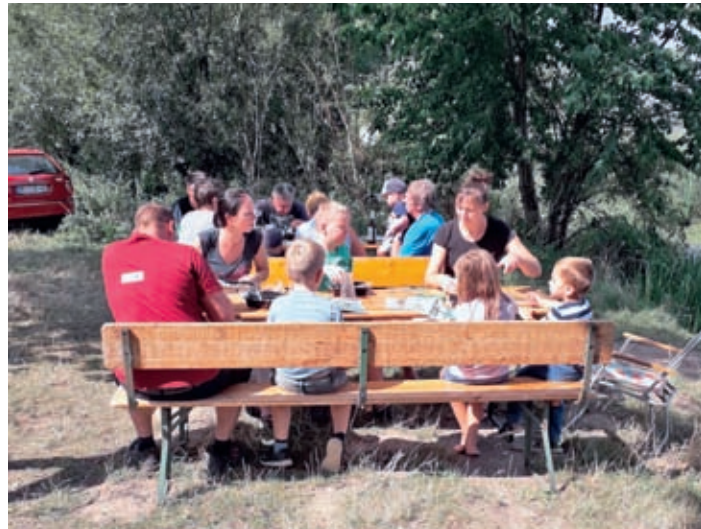
Gemütliches Beisammensein zum Familienangeln

Ein weiteres Highlight der Jugendgruppe war das Gemeinschaftsangeln mit dem Anglerverein Silbersee Lohsa, am Schulteich in Lohsa. Dieser kleine Dorfteich ist extra für Jugendgruppen hergerichtet wurden. Eine Jägerbank zum Abstellen der Verpflegung, ausreichend Platz zum Werfen und ein Fischbesatz der sich sehen lassen kann, boten uns optimale Bedingungen. So kam es auch, dass an diesem Tag fast jeder Jungangler mehr als einen Karpfen fangen konnte. Damit wurde der einsetzende Regen zur absoluten Nebensache.