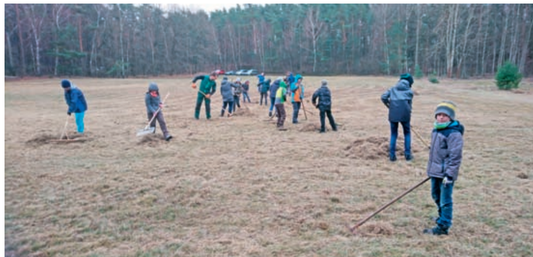
Die Forstwiese im NSG Waldmoore Großdittmannsdorf wurde vom Rasenfäulnis befreit, das schaffte bessere Bedingungen für eine blütenreiche Wiese mit vielen Insekten.

eule und Waldkauz standen. Im Frühjahr ging es mit der Leiter hinaus. Entlang des Lehrpfades in der Radeburger Heide kontrollierten wir unsere 20 Nistkästen