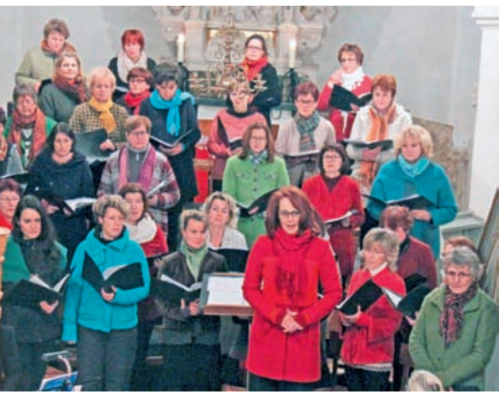
2017 bei einem Konzert des Frauenchores neu geweiht. Der Eintritt ist frei, um eine Spende wird beim Ausgang gebeten. ▲ Freude durch Gesang mit anderen zu teilen, ist den Frauen des Chores wichtig.