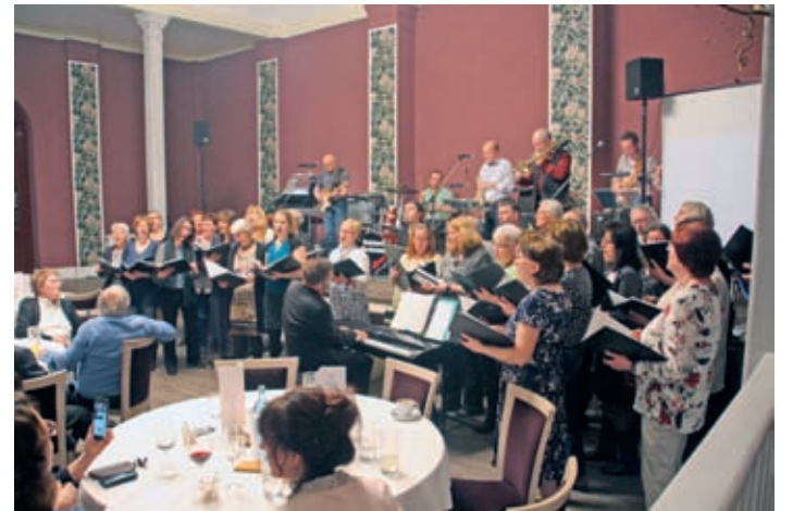
Der Wantewitzer Kirchenchor pflegt ein vielgestaltiges Repertoire, das neben geistlicher auch Unterhaltungsmusik umfasst.

Der Kirchenchor Wantewitz plant für das Jahr 2020 zwei größere Projekte, zu denen gern noch SängerInnen hinzustoßen können: Einmal wird er sich zu seinen Wurzeln aufmachen und die