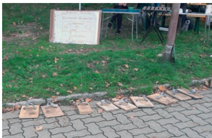
Holger Bachmann hat uns die Fußbrettchen gemacht, die für jeden Fuß persönlich angepasst wurden und im Anschluss mit nach Hause genommen werden durften.

Am 29.09.2019 war es endlich soweit: mit zahlreichen Kindern und deren Eltern, sowie Anwohnern und Freunden wurde die „Grundschulblühwiese“ an der Buswendeschleife am Meißner Berg angesät. Beim anschließenden 1. Blühwiesenpicknick gab es bereits neue Ideen für die Gestaltung der Fläche: Holzhaus Rico Sachse stellt sie uns zur Verfügung. Ein Lesestein- und Totholzhaufen wird für Unterschlupf für Spinnentiere, Kleinsäuger und Eidechsen sorgen. Inzwischen kann man auch sehen, dass die Saat aufgeht: im Inneren die Wiesenfläche mit vielen verschiedenen Gräsern und außen sieht man bereits die kleinen Stauden, die nächstes Jahr für ein tolles „Bunt“ sorgen werden.