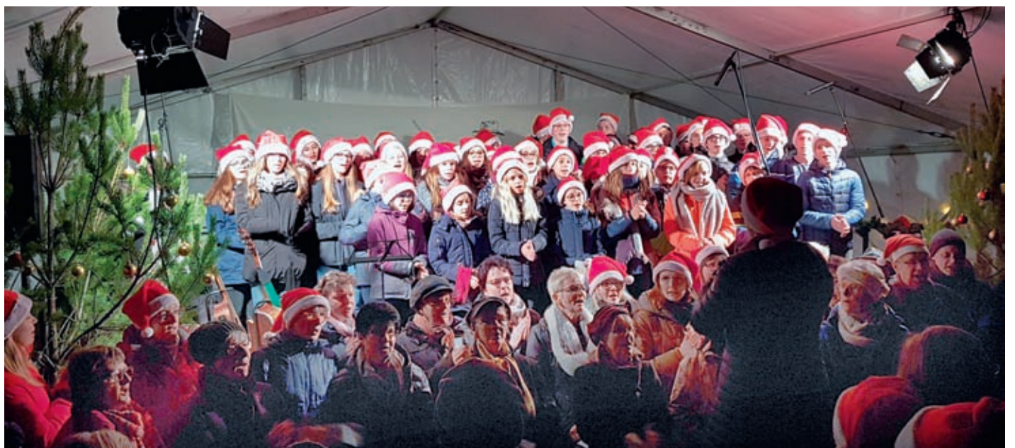
Traditionell bildete der gemeinsame Auftritt des Chores der Heinrich-Zille-Oberschule und des Kultur- und Heimatvereins Radeburg den kulturellen Abschluss. Noch gut eine Stunde ging es noch weiter bei Glühwein und Punsch, Backwerk und Bratwurst.