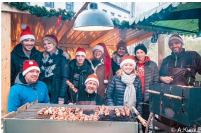
Der absolute Hammer und mal ein Extra-Foto wert: der Schaschlik von den „Bärnsdorfer Speißern“ mit dem Besten, was man auf einem Speiß bekommen kann zu einem fairen Preis.

Weihnacht Lichter in der Stadt und in den Straßen. Weihnacht strahlt aus jedem Haus, selbst der Brunnen auf dem Marktplatz sieht geschmückt und festlich aus. Lieder klingen aus der Kirche, Kinderstimmen hell und klar und ich denk mit Wehmut daran, als ich selbst ein Kind noch war. Streif durch menschenleere Gassen, langsam neigt sich dieser Tag, hier war ich willkommen und behütet, unter Menschen die ich mag. Und ich falte still die Hände, foto für die kleine Stadt, die für alle die hier leben, ihren stillen Frieden hat. Angelhaucht mit weißem Zauber und mit hellem Lichterschein, denke ich in Goethes Größe: hier bin ich Mensch – hier darf ich sein. Angelika Weber