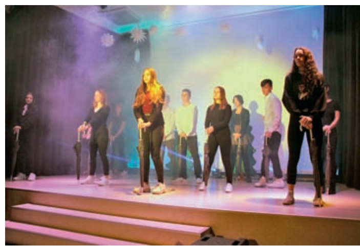
Tanz im Regen – mit den von der CG Gruppe gesponserten Regenschirmen.

Herr Gerlach am zweiten Abend resümierte. Diese änderte sich schlagartig in der Pause. Die Gäste schlenderten in einer besinnlichen Atmosphäre über die liebevoll weihnachtlich dekorierten Gänge und lauschten dem musikalisch vielfältigen Repertoire der Schulband. Währenddessen warteten, unten auf dem Schulhof, bereits die Schülerinnen und Schüler des Schulclubs und der Zillebäcker vorfreudig auf ihre Gäste für den traditionellen Weihnachtsmarkt. Neben kulinarischen Köstlichkeiten wie gefülltem Fladenbrot, Bratwurst und Glühwein, hatten die Gäste die Möglichkeit, liebevoll gestaltete Kleinigkeiten wie Kräuteröle, Plätzchen, dekorierte Bilderrahmen und Brottüten zu erwerben und an einer Tombola teilzunehmen.