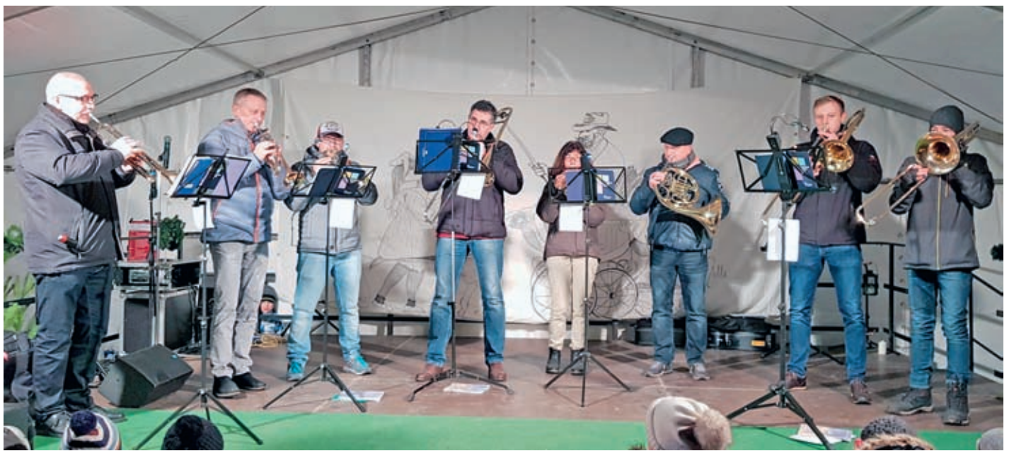
Der Posaunenchor der Ev.-Luth. Kirchgemeinde schloss den „Adventsvorabend“ ab.