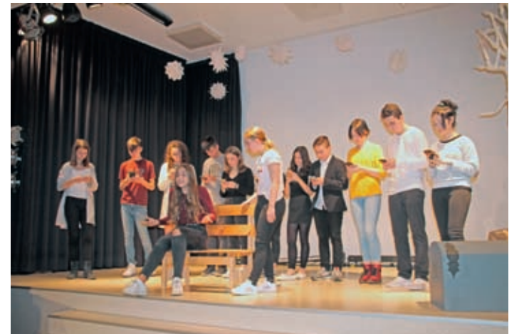
Braucht man immer ein Smartphone?

Den musikalischen Höhepunkt und zweiten Teil des Weihnachtspro-