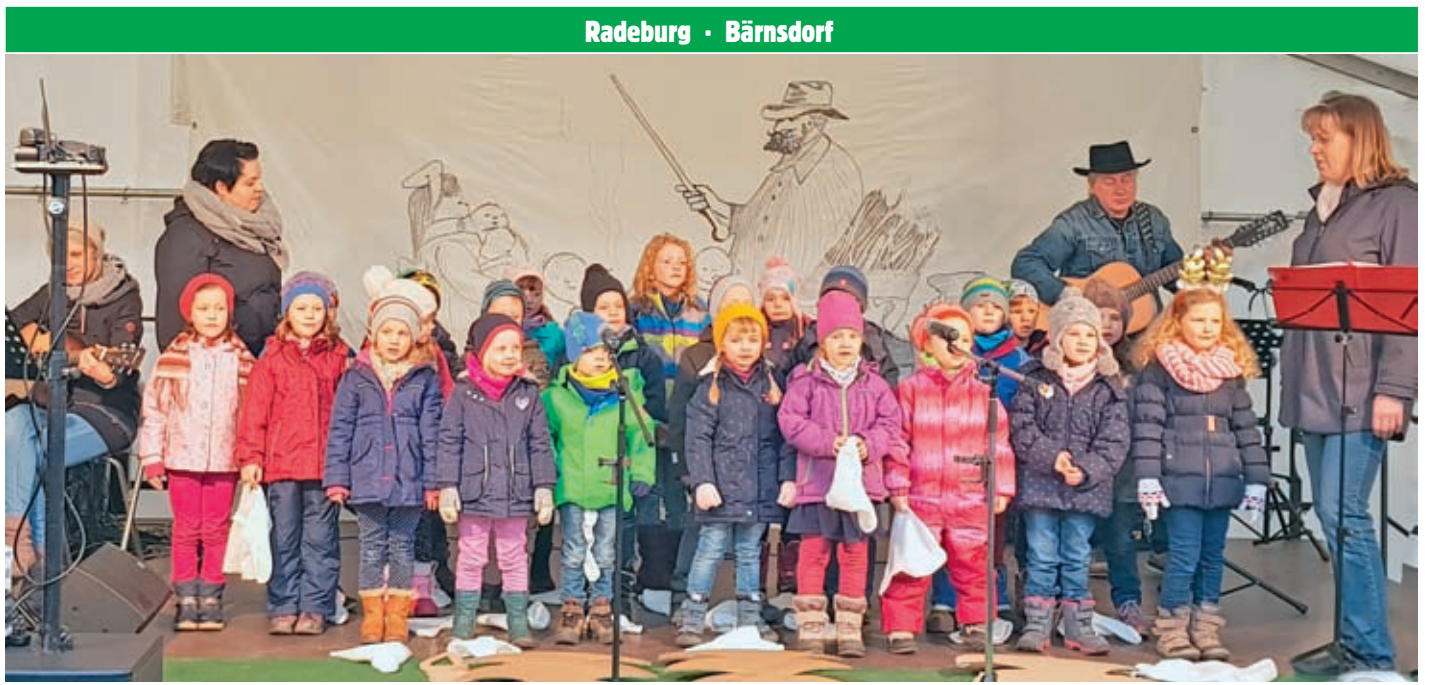
Den Auftakt zur nun schon 18. Auflage der Zilleweihnacht gab der Kinderchor der KiTa „Sophie Scholl“ des Kinderschutzbundes.