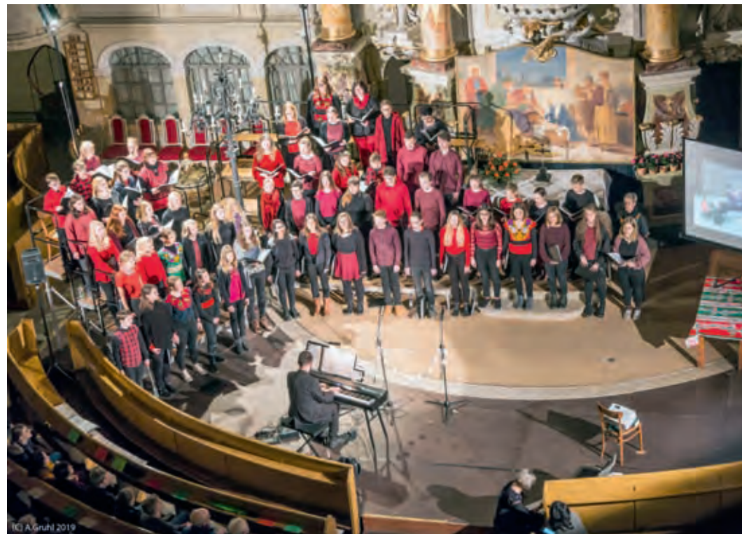
Eindrücke für alle Sinne bietet das weihnachtliche Reiseberichtskonzert „Mexico, Mexico!“, dass der Jugendchor Großenhain-Reinersdorf-Ebersbach am 27.1. um 17 Uhr zum letzten Mal in der Kirche Lampertswalde präsentiert.

Eindrücke für alle Sinne von der zweiten Begegnungsreise des Jugendchores Großenhain-Reinersdorf-Ebersbach nach Mexico