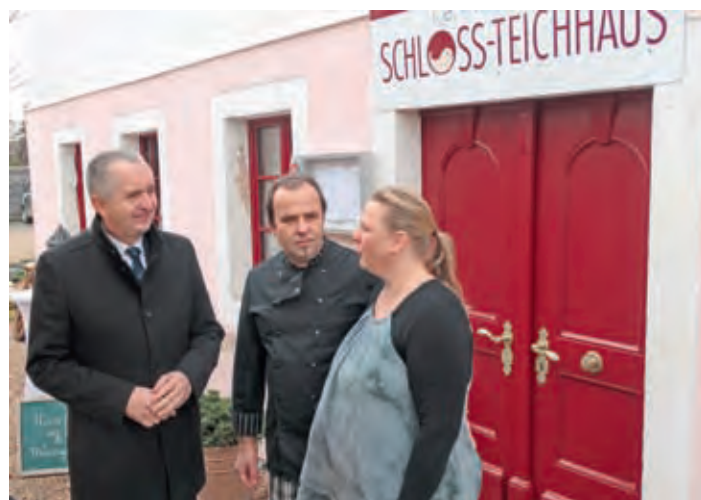
Familie Kuschke im Gespräch mit Staatsminister Thomas Schmidt.

jekt war die im Dachgeschoss des Hauses der Familie Kuschke befindliche eigengenutzte Wohnung. Es erfolgte ein komplet-