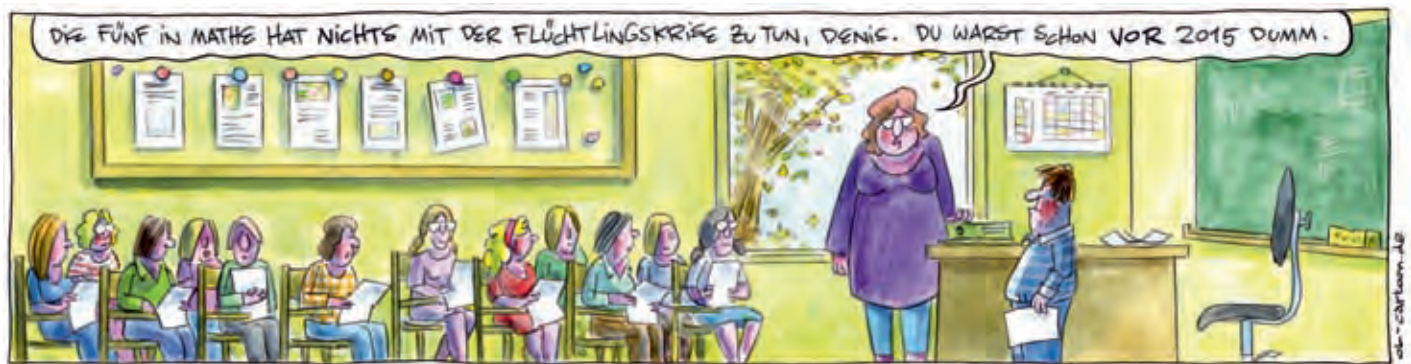
Mit diesem Bild gewann OL den Karikaturenpreis.