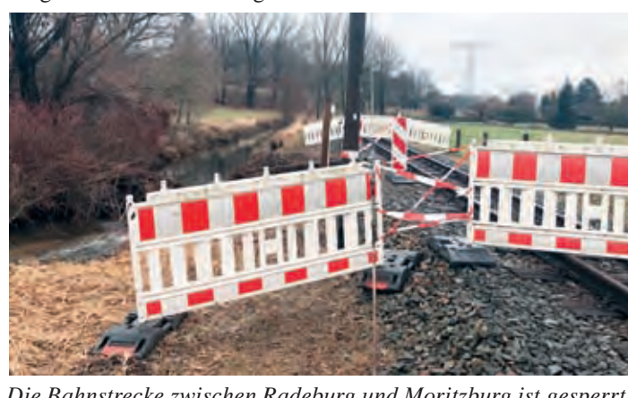
Die Bahnstrecke zwischen Radeburg und Moritzburg ist gesperrt

werden, da das Wasser sehr stark zurückgegangen ist und somit der Gegendruck für die Bäume gefehlt hat. Jetzt auch noch ein Biber im Teich wäre für die noch bestehenden Bäume nicht so gut. Im Moment gibt es keine weiteren Anzeichen dafür, dass der Biber in der Promnitz weiterhin aktiv ist.