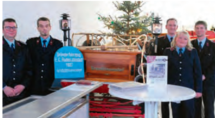
Kameraden vor den Altgeräten

Alle Räumlichkeiten sind zukünftig unter einem Dach vereint. Das Gerätehaus bietet zwei Stellplätze, die auch mit einer