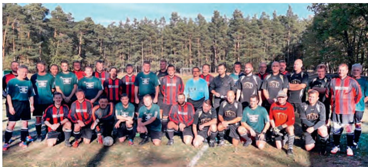
Die befreundeten Altherrenteamen von Großdittmannsdorf und Berbisdorf stellten sich zum Erinnerungsfoto.