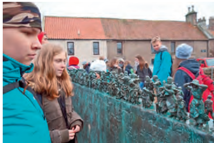
Am Denkmal in Eyemouth, das 189 Toten gedenkt.

den Schulen ist die Zusammensetzung des Stundenplans. In Deutschland haben wir alle Fächer von den Naturwissenschaften bis zu den kreativen Bereichen. Im Kelso dagegen können die Schüler ihre Fächer selbst wählen, nur was Pflicht ist, ist, dass die Schüler in