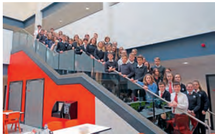
Gruppenfoto der Reisetilnehmer

haben im Unterricht gesessen. Es gibt viele Unterschiede zwischen den beiden Schulsystemen. Handys zum Beispiel sind in Kelso im Unterricht erlaubt und wenn man dort auf die Toilette geht, muss man sich in eine Liste eintragen und wenn man zurück kommt auch dort unterschreiben, doch der größte war die Schuluniform. Nach der Schule sind wir mit unserem Partner nach Hause gegangen und haben dort den Rest des Tages verbracht, bis wir wieder zurück ins B&B gebracht wurden. In dieser Zeit haben manche Filme geschaut, waren Squash spielen, haben eine Stadttour gemacht oder Spiele mit ihrer Familie gespielt. Die Menschen in Schottland sind alle sehr herzlich und richtige Familienmenschen und was den traditionellen Tee angeht, den gibt es tatsächlich. In meiner Familie zum Beispiel gab es jeden Tag Tee. Ein weiterer Unterschied zwischen