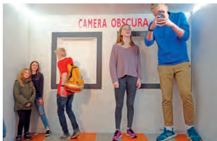
In der Camera Obscura.

den Klassen 5 bis 7 an der Kelso High School die Fremdsprachen Deutsch und Französisch belegen müssen und sich erst danach entscheiden können, welche sie und ob sie sie überhaupt machen wollen. Wir realisierten, dass wir wirklich auf die englische Sprache angewiesen sind. Doch gerade dadurch haben wir gelernt und schon nach unserem ersten Tag hat sich unser Englisch verbessert.