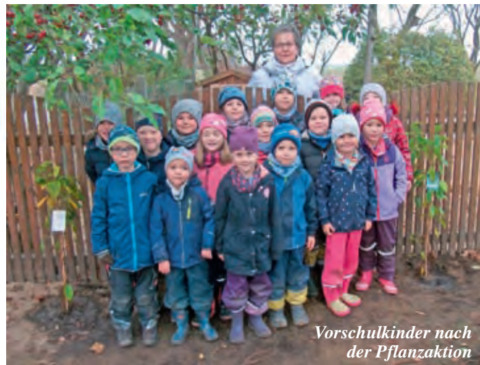
Vorschulkinder nach der Pflanzaktion

Höhepunkte und Feste im Jahreslauf zu feiern, um den Kindern Rituale und Traditionen nahe zu bringen, ist ein Anliegen unserer Kita und gelingt gut in der vertrauten Gemeinschaft. Bereits vor der Adventszeit steht das Baum pflanzen in unserem Kalender und wird jährlich von den Vorschulkindern organisiert: