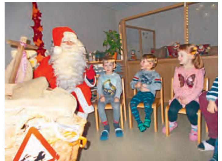
Besuch vom Weihnachtsmann

Seit wir Große Gruppe sind, vergeht die Zeit für uns geschwind. Bald heißt es schon Ranzen kaufen und den Schulweg Probe laufen. Doch dass ihr uns nicht vergesst, gibt's im Herbst ein kleines Fest. Bei dem Fest, so ist es Brauch wird gepflanzt ein schöner „Strauch“. Wenn wir mal nach vielen Jahren diesen Strauch dann wieder sehen, wollen wir vor lauter Freude gleich noch mal zu den Mühlenwichteln gehen.