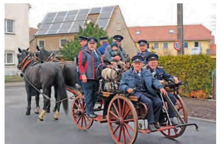
Die Mitglieder der Alters- und Ehrenabteilung wurden mit der Kutsche abgeholt.