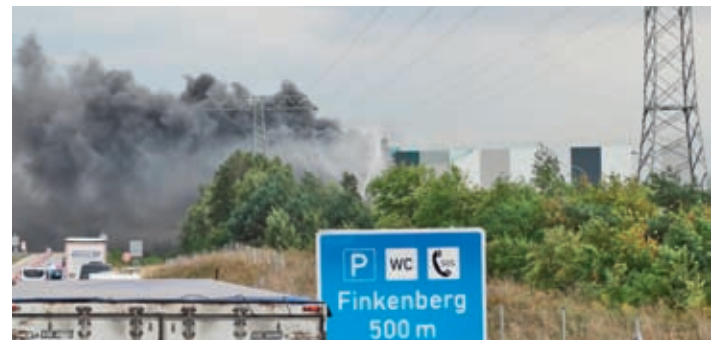
Die heftige Rauchentwicklung war auch dramatisch für die Autobahn. Sichtweite Null. Für fast eine Stunde musste die A13 voll gesperrt werden.

Am Montag, dem 13. August 2018, brach gegen 16 Uhr im Zuge von Dacharbeiten an einer neuen Lagerhalle ein Feuer aus, das die Handwerker zunächst selbst zu löschen versuchten, dann aber die Feuerwehr zur Hilfe rufen mussten.