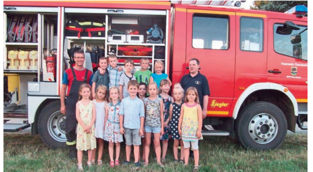
Vor der Ausfahrt wurde die Feuerwehr genau inspiziert.

Nun war der Weg frei für einen neuen wichtigen Schritt – den Start der Mühlenwichtel in die Grundschule.