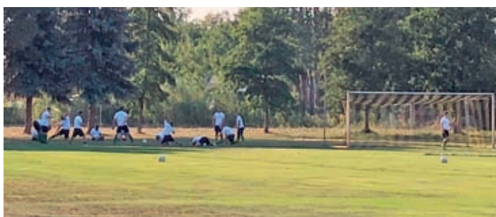
Die Mannschaft des Berbisdorf SV bereitet sich auf das Spiel gegen Radeburg vor.

war, wie jedes Jahr, ausreichend gesorgt. Wer Lust hatte, konnte sich auf der Hüpfburg austoben oder beim Torwandschießen seine Fähigkeiten zeigen. Wem das aber alles zu wild war, der hatte auch die Möglichkeit, sich beim Kinderschminken zu verschönern. Von 14 bis 18 Uhr stand der Radeburger Fußball-Cup für Freizeitmannschaften im Focus. Von 15 bis 18 Uhr konnten alle Gäste, die über 14 Jahre waren, sich beim Radeburger Zille-Kegel-Cup mal austesten und vielleicht das Kegeln für sich entdecken. Um circa 18:30 Uhr wurde es etwas ruhiger. Alle Besucher, die den ganzen Tag am Rand mitgefiebert hatten und natürlich auch die Spieler selbst, konnten der Livemusik der Coverband „Fristo Kid“ folgen und das eine oder andere Bier dabei trinken. Der Plan für den letzten Tag der Olympiade steht schon, denn ab morgen heißt es noch