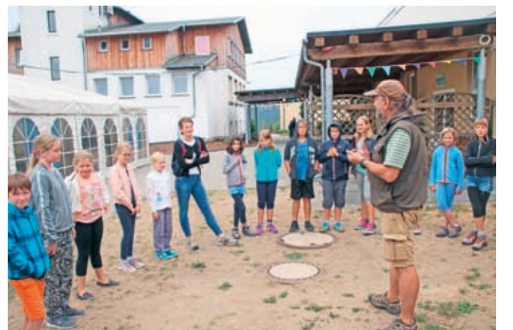
Klasse 5c in Sebnitz beim Teamtraining