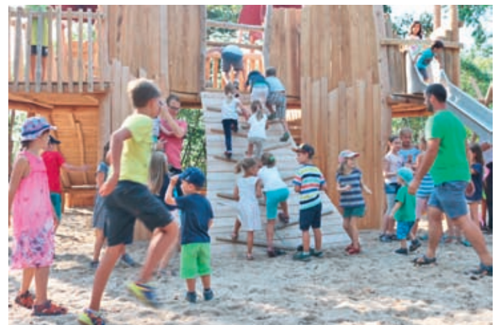
Fünf Jahre von der Idee bis zum Mehrgenerationenspielplatz. Endlich können ihn Jung und Alt in Besitz nehmen – natürlich nicht nur Moritzburger.