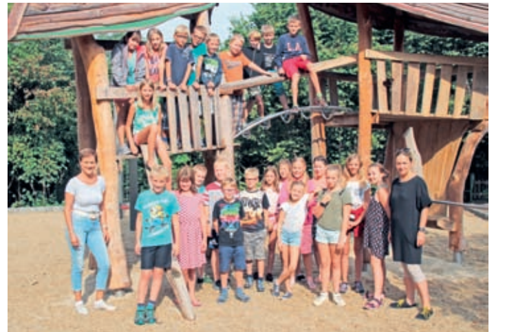
Klasse 5b in Sebnitz auf dem Spielplatz

Die Lehrer und Schüler der Oberschule Radeburg