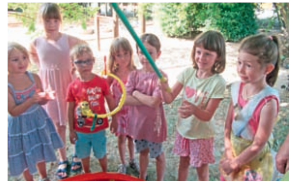
In unserem See gab es allerhand Müll zu angeln

Natürlich durfte auch eine zünftige Party nicht fehlen. Das Team der Kita möchte sich auf diesem Wege noch einmal für die tollen „Müllkostüme“ bedanken, die alle Eltern für ihre Kinder gestaltet haben. Auch wenn zum Feriendeckel unser Spielzeug wieder zurück kehrte, bleibt das Thema Müll trotzdem ein wichtiger Bestandteil in unserem Kita – Alltag.