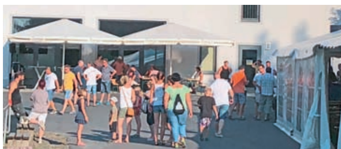
Zahlreiche Gäste haben auch in diesem Jahr wieder den Weg zur großen Olympiade gefunden