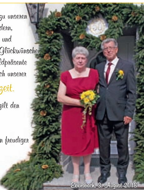
Ebersbach, 3. August 2018