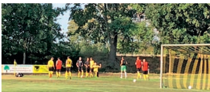
Die Gastgeber machen sich schon mal für das erste große Spiel gegen den Berbisdorf SV warm.