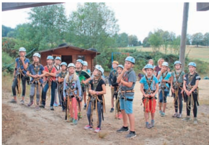
Klasse 5a im Hochseilgarten in Sebnitz